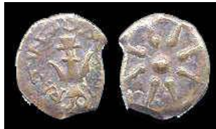
מטבע מלכותי של המלך אלכסנדר ינאי. הכתוב ביוונית "של המלך אלכסנדר"

אלכסנדר ערך שינויים מהותיים בטביעה. בנוסף לטיפוסים של קודמיו, טבע מטבעות מלכותיים, בהן מטבעות דו-לשוניים. הכתובות עליהם מופיעות בכתב עברי קדום 6 או בארמית ויוונית, השפות השגורות בפי תושבי הממלכה. במטבעות הדו-לשוניים של אלכסנדר ינאי מופיעים דגמים חדשים. הכתובות על המטבעות מציינות את תואריו, העוגן שימש במטבעותיו כסמל מלכותי. נטבעה גם סדרה קטנה של מטבעות מעופרת, שעל רובם ניתנת לזיהוי בבירור הכתובת "של אלכסנדר המלך" ביוונית. יש לציין שהתגלו שתי בולות הנושאות הכתובת "יהונתן המלך", ו"יונתן כהן גדול ירושלים".