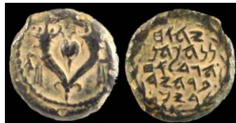
מטבע הורקנוס עם האות אלפא ביוונית מעל הכתובת בעברית

לאחר מות אנטיוכוס השביעי בשנת 129 לפסה"נ, השמיט יוחנן את האות אלפא מעל הכתובת בעברית במטבעותיו. נוסח הכתובת העברית "יהוחנן כהן גדול וחבר היהודים" נותרה. מצב זה מעיד על עצמאות מוחלטת. על פי יוסף בן מתתיהו ב"קדמוניות היהודים", כיבושיו של הורקנוס להרחבת ממלכתו החלו מיד עם מותו של אנטיוכוס. בהתחשב במעמדו של הורקנוס ואי תלותו בשליט הסלבקי דמטריוס השני, ניתן לייחס את המטבעות הנזכרים עם האות אלפא לשנת 130 לפסה"נ לערך ואת המטבעות ללא האות אלפא לשנת 129 לפסה"נ, עת יצא לפי יוספוס מיד למסע כיבושים בארץ ישראל או לשנה שלאחריה, דהיינו לשנת 128 לפסה"נ.