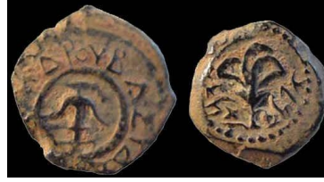
מטבע מלכותי של אלכסנדר ינאי. בצד אחד פרח שושן והכתובת בעברית "יהונתן המלך". בצד השני עוגן מלכותי והכתובת ביוונית "של אלכסנדר המלך"